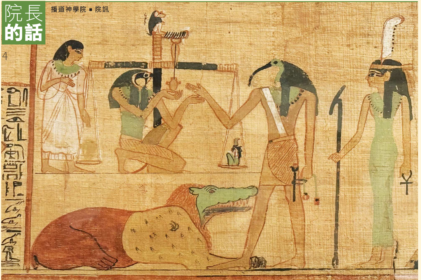
近日「古埃及文明」展中《亡者之書》內「衡量人心」繪圖